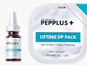
Soin Lifting Program PEPPLUS+