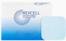
Disques Nettoyants Moussants Aux Enzymes REVCELL